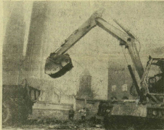
A könyvtár-levéltár helyén dolgoznak már a földmunkagépek

Az oktatási központ a szomszédos házak ritmusát ismétli meg