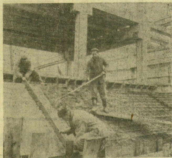
Ebből a lejtőből lépcső lesz

Vasbeton pillérek és acélszerkezetek, emelődaruk és hegesztőpisztolyok — a nagyáruház építőinek kellékei, munkaeszközei. A sokáig a föld felszíne alatt, vagy a kerítés magasságánál lejjebb dolgozó DÉLÉP-es brigádok tagjai már a magasba nyúló pillérek között szerelik az acélelemeket. Az épület csontváza láttán persze még nehéz elképzelni, milyen is lesz a Jókai utcai üzletközpont, az azonban már sejthető, hogy méreteivel minden eddigi szegedi üzletet leköröz majd.