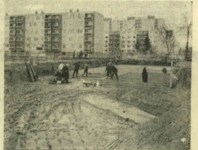
Lelejtik a szerelőbetont