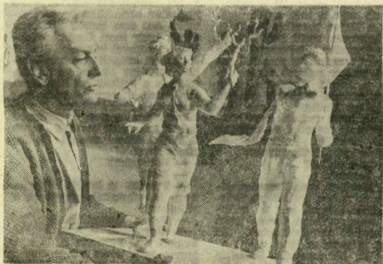
Kerényi Jenő a Díszfelvonulás zászlóval, virággal című művével

A napokban adták hírül a lapok, hogy Szentendrén átadták a város legújabb képzőművészeti gyűjteményét, a Kerényi Jenő Múzeumot. Most lenne hetvenéves a modern magyar szobrászat iskolateremtő mestere, akinek 1948-ban felállított szobrája a Partizán-emlékműve mérföldkő a magyar szobrászat történetében. A nemrégiben nemzetközi kiállítások kiállítás legemlékezetesebb részlete volt Kerényi Jenő retrospektív tárlata. Ismételtlen bebizonyította, hogy egész művészetének központja az ember, melyről szólva a szobrász végigjárta a játékoság, az erotikus szépség, a túláradó életöröm útjait. eljutott a nagy drámai problémákig, a létezés alapkérdéséig. Elettudomány tanulság és példa nemcsak az őt követő szobrászgenerációk, de a képzőművészet-szerető közönség számára is.