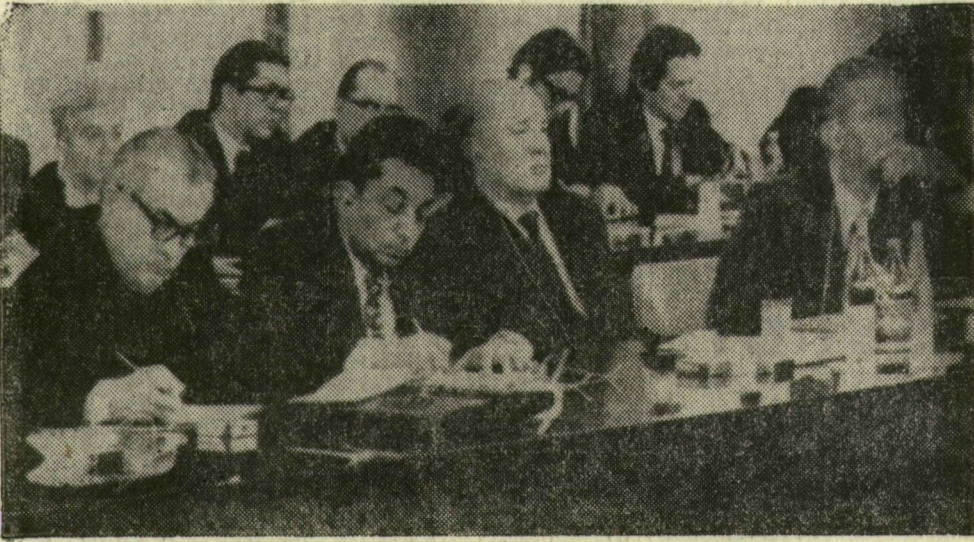
Képünkön: a Kádár János vezette magyar delegáció.

Szerdán Moszkvában megkezdte munkáját a Varsói Szerződés tagállamai politikai tanácskozó testületének ülése.