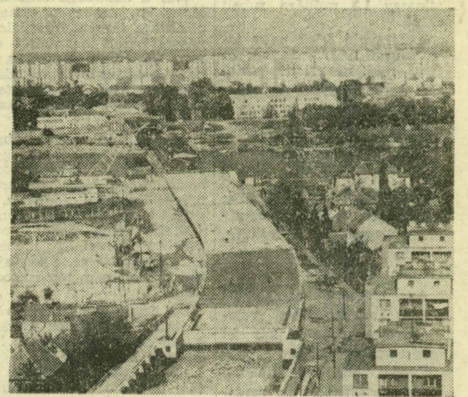
Látékép a híd újszegedi kanyarjáról

Második hetébe lépett a a Szovjetunió európai részének északi felén tér el az időjárás a miénktől. Ott élénk kelet-nyugati irányú légáramlás van, változékony, csapadékos az idő, a hőmérséklet csúszértéke viszont a szokásosnál mintegy 3-7 fokkal magasabb. Hazánk időjárása a tegnapi közlekedést a hajnali, reggeli órákban lényegesen nem befolyásolta, a vonatok, a távolsági autóbuszok lényegében rendben közlekedtek. A Ferihegyi repülőtér is fogadta és indította a gépeket, csupán a reggeli berlini és varsói járat indult késve, mintegy két órával, a fogadó repülőtér időjárása miatt. (MTI)