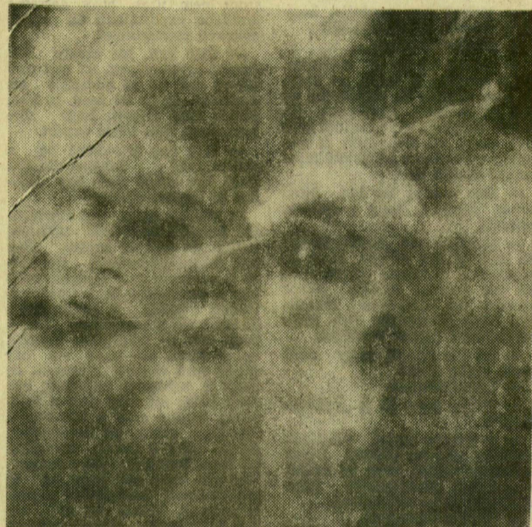
A fából faragott királyfi

Gink Károly fotói Bartók szinpadí műveihez