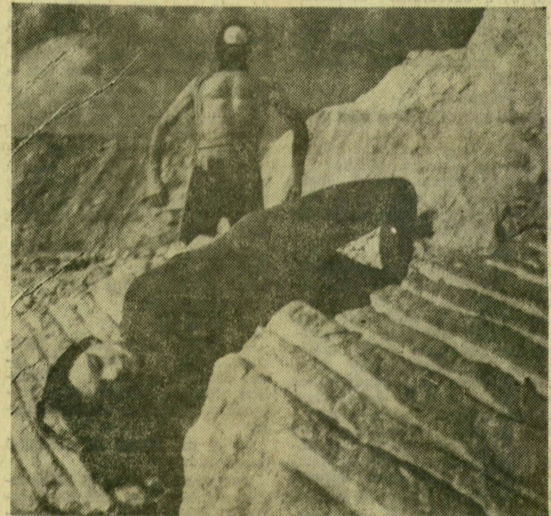
A kékszakállú herceg vára