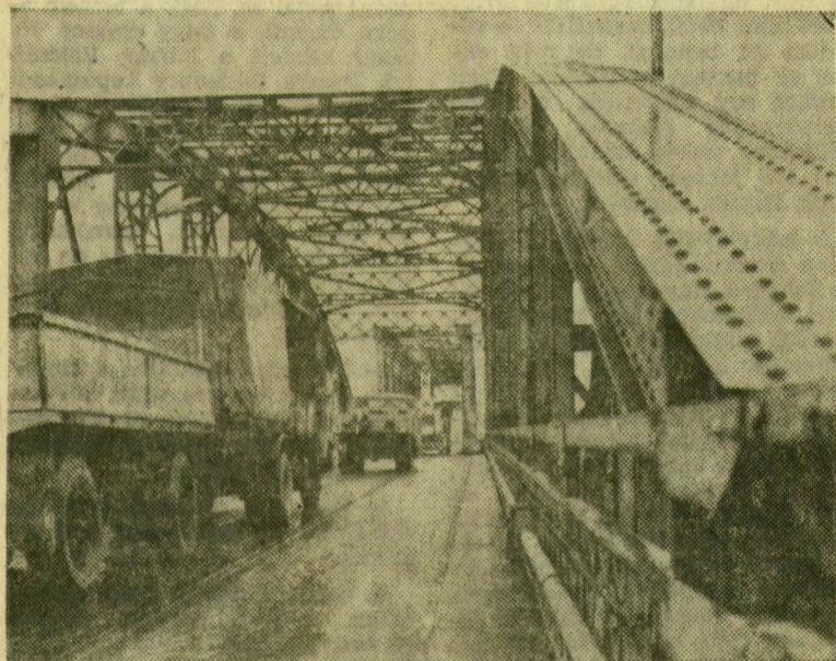
Az öreg közúti és vasúti híd

Nem kell ennek a felfutó szőlőnek se permetezés, se metszés. Nő, terem magától. Nyáron naptól véd, télen hótól.