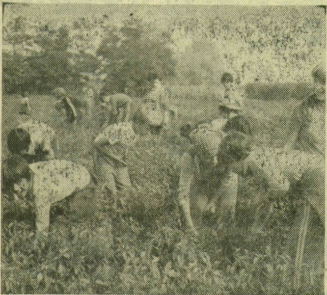
Lendülettel és játékos munka Bordányban, a szereplők a szegedi kisdíjak