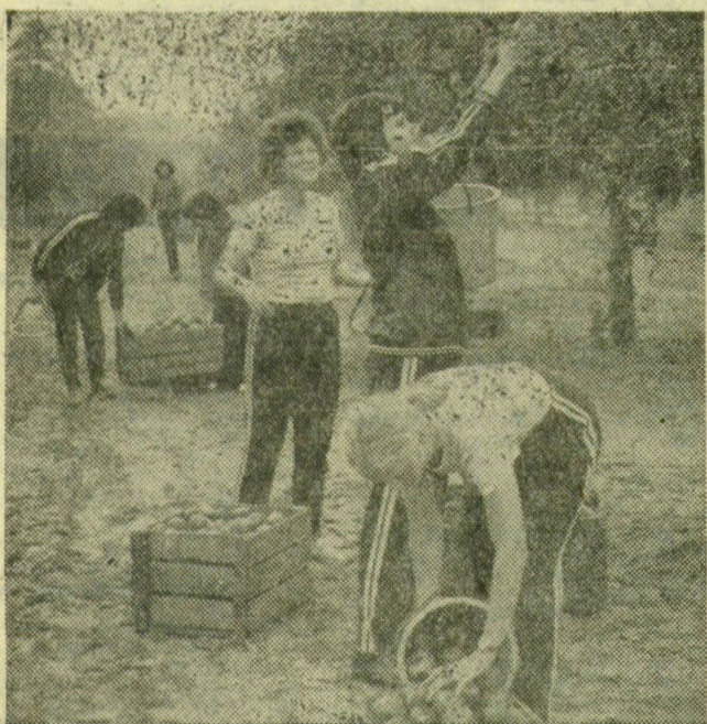
A védőnőképzés lányok szüretelik az almát Ruzsán