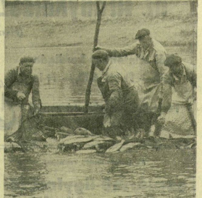
Ez a legnehezebb: hálóból a ladikba emelik a halat

Aki nézi, gyönyörködik az őszi Tiszában, aki belőle él, panaszkodik rá. Magasan jár, a holtágakat se lehet lecsapolni, mély vízben pedig nehezebb a munka, és kevesebb halat kerít be egy húzásra a háló. Próbálgatják még csak a nagy, őszi hálózást Szeged és Vásárhely halászaik Atkaszegénél. Egész évben külön dolgoznak, a nagy munka, az őszi „betakarítás” idején azonban összefognak. Huszonötven kapaszkodnak bele a hatalmas hálókba, combig érő gumicsizmában tapossák a vizet, és az első fogásokból arra következtetnek, körülbelül tizenkét vagon kifogható hal lehet a foltó egykori medrében.