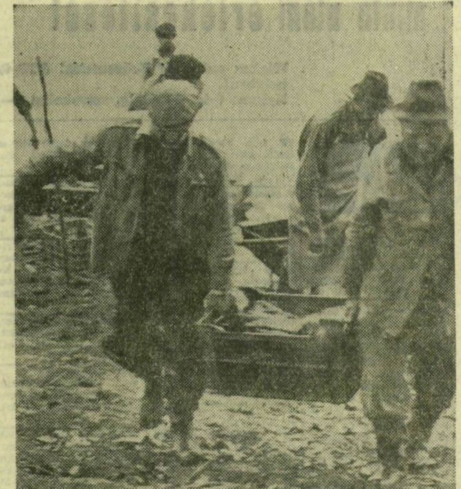
Mérés után tartályba hordják, gépkocsival viszi Gyomára, a földolgozóba