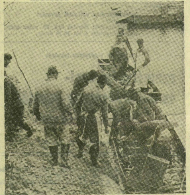
„Háromnyaras” busa a ladikban, darabja 2,5—3 kiló