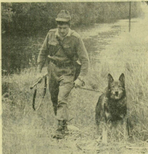
Szolgálatban a határ mentén

külföldre szökését akadályozta meg. A család tagjainak bűnösségét kétséget kizáróan bizonyítja, hogy az illetékes bíróság a négytagú családnak — különböző bűncselekmények elkövetése miatt — összesen százharminc hónapra szóló fegyház, szigorított börtön, illetve börtönbüntetést szabott ki.