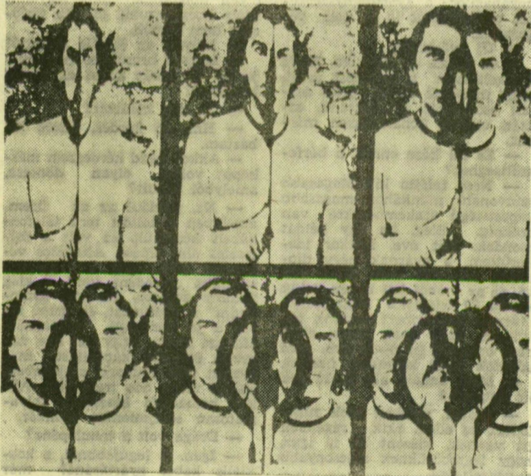
PINCZEHELYI SÁNDOR ALKOTÁSA A PÉCSI MŰHELY TÁRLATÁRÓL