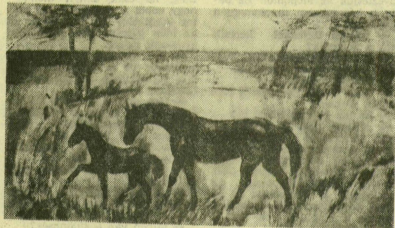
DÉR ISTVÁN: LÓ CSIKÓVAL