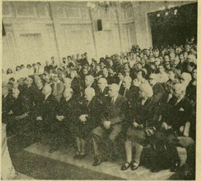
Jubileumi diplomások a SZOTE tanévnyitóján