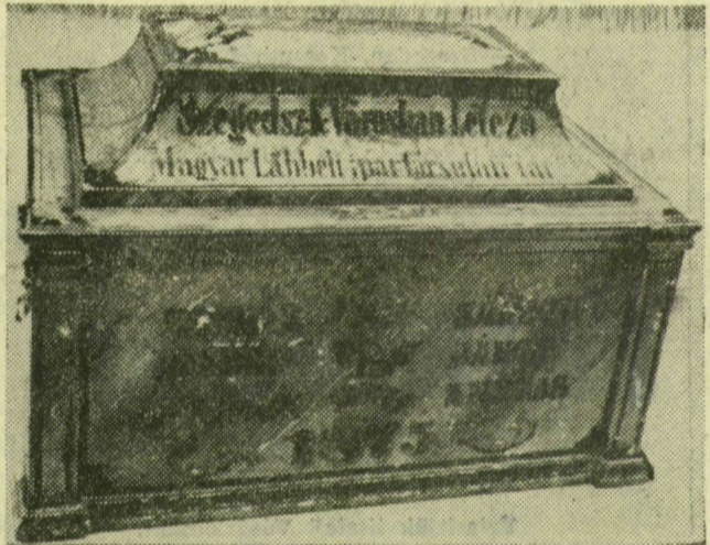
A lábbeli ipartársulat céhládája 103 éves