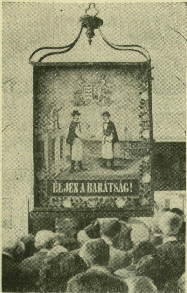
Igy nézett ki az ács- és kőművescégér

A KIOSZ Csongrád megyei szervezete kiállítást rendezett a Horváth Mihály utcai képtárban, a Kisiparosok Országos Szövetsége megalakulásának 30. évfordulóján. A ma is jól ismert és a már régen kihalt vagy feledésbe merült szakmák emlékeit tárják a közönség elé. Képsorunkkal hátról érdekes mutatókat mutatunk be.