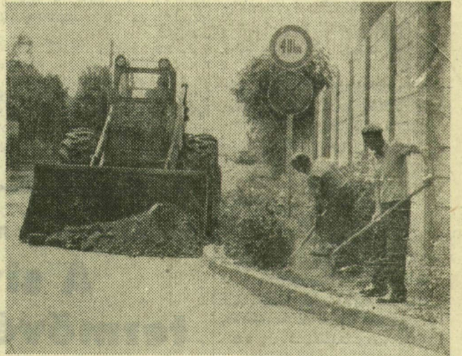
Tisztítják az útszegélyt az Állomás utcában

Sokáig hasonló mostoha útviszonyok jellemezték a Nagyállomás mögötti területet. A Fővám köz egy részén és az Állomás utcán a felújítás után érezhetően megváltozott a közlekedés, de a Fővám köz másik szakaszán és a Szövetkezeti úton továbbra is a régi kockaköveken rázkódnak a kerekek. Az Április 4. újtára legközelebb az öreg vasúti aluljárón át lehet eljutni, amely máris túlságosan szűk a magasán megakart járműveknek, hát még, ha az út újjaépítésekor emelkedne a burkolat szintje. Ráadásul az Indóház tér rendezéséhez is alkalmazkodni kell a munka során, ennek pedig egyelőre még csak a A csatornázás és a megővetervezésénél tartanak. Távolabbi elképzelés szerint a vasúti töltés átvágásával az