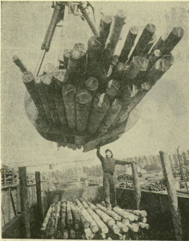
Az ERDÉRT Vállalat 14. számú gyáregysége tuzséri telepére évente több millió köbméter fa érkezik a Szovjetunióból vasúton. A korszerű anyagmozgatásnak köszönhető, hogy az osztályozás után rövid idő alatt eljut az ország legkülönbözőbb részére a feldolgozásra váró fa. Képzőnkön: portáldaruval rakják a fát