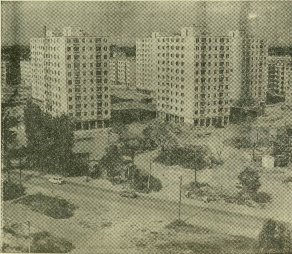
A tízemeletes épületek előtt a park egyelőre még kialakításra vár