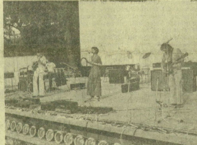
A színpadon a Fanti-együttes

ban megnyitják a XI. világifjúsági és diáktalálkozót. A világ ifjúságának nagy találkozója egybeesik az ország ifjúságának szegedi seregszemléjével. Ez a véletlen és szerencés egybeesés szimbolikus is lehet — a fiatalok békevágyát, hazaszeretét, internacionalizmusát fejezi ki, s módot ad az új ismeretek szerzésére, barátságok szövődésére, szórakozásra.