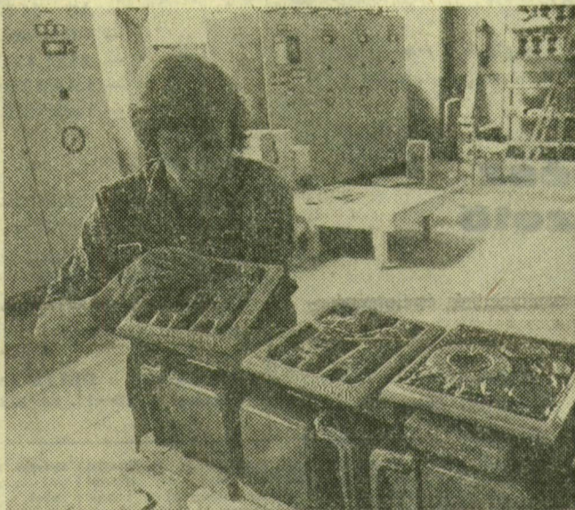
Elkészült a Komárom megyei Kályhacsempé Gyártó és Építő Vállalat kályhacsempégyára. Az új gyárban évente kétezer tonna kályhacsempét készítenek