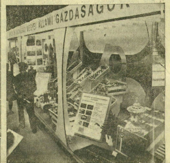
A Békés, Csongrád megyei állami gazdaságok színvonalas kiállításukért és gyümölcseikért, valamint tájjellegű húsiipari készítményeikért elnyerték a vásárigazgatóság nagydíját