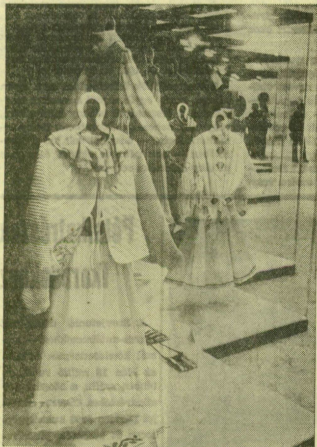
Részlet a kiállításról

A VIT-pályázat anyagából kiállítás nyílt a Magyar Nemzeti Galériában. Festmények, fotók, bútorok, iparművészeti tárgyak, szönyegek, ruhák szerepelnek a kiállításon — fiatal művészek alkotásaiból.