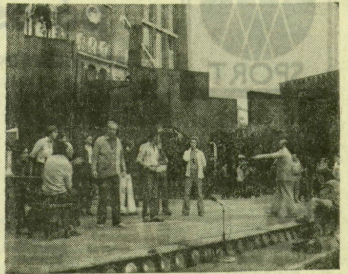
Egy jelenet a próbáról

báltak. Ma és holnap övök mierdarab, a Hunyadi László a templom előtti tér, csütörtökön viszont az idei pre-dája foglalja el a terepet.