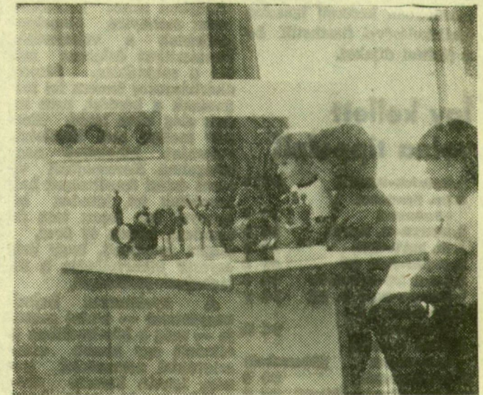
Részlet a kiállításról