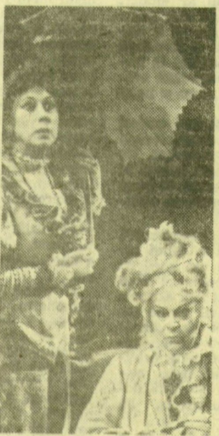
Dayka Margittal a Párizs bolondjában