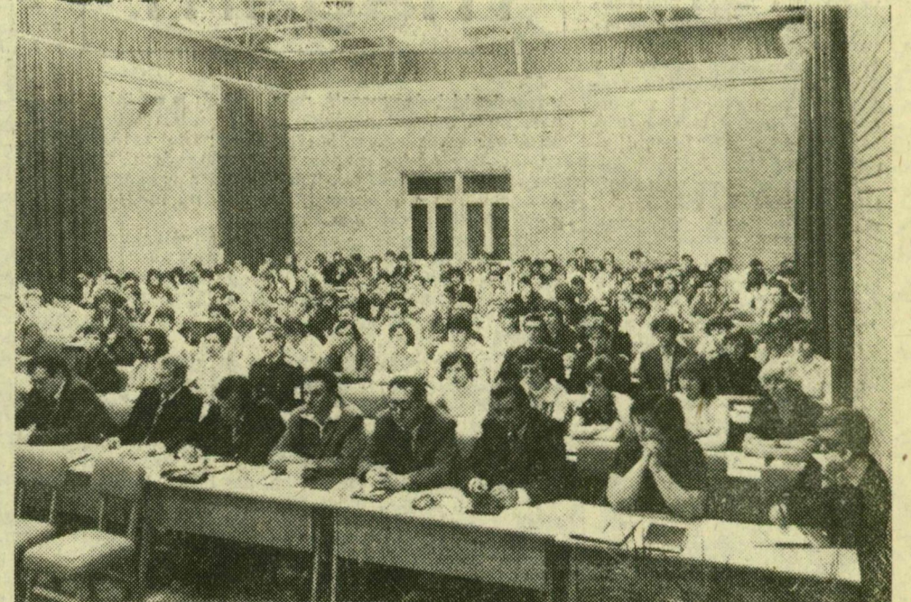
A tanácskozás szünetében a megyei vezetők a küldöttekkel beszélgetnek