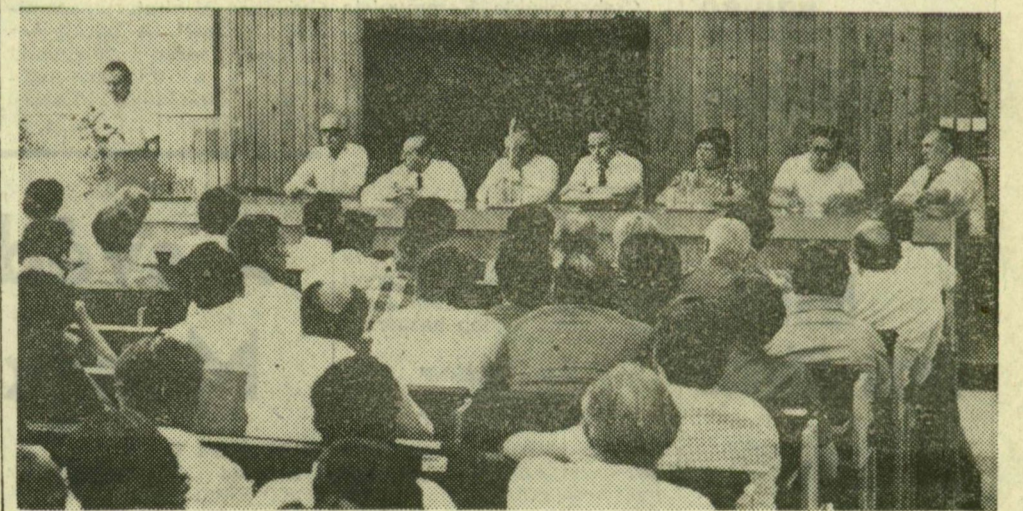
A megyei oktatási igazgatóságon tartott aktívaülés elnöksége