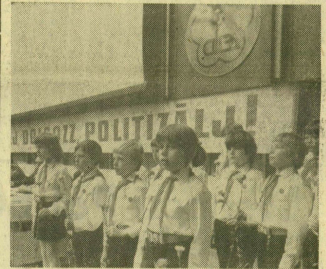
Üttörők köszöntik a résztvevőket