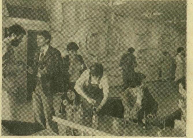
A szünetben is tart az eszmecsere