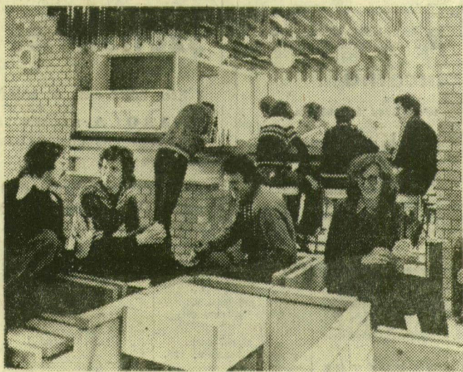
Élet a társalgóban