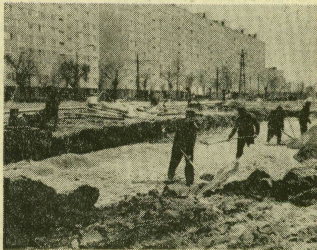
A szegedi házygár pane'ja'ból épü nek majd az előkészítés és alapozás után a házak