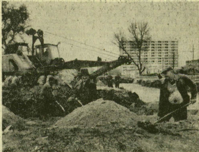
A villamossínek mellett a földmunkákban az emberi erő is segíti a gépet