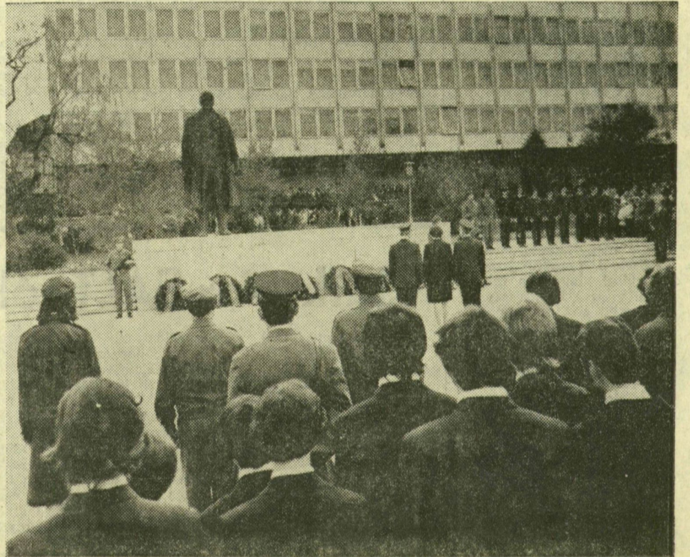
A koszorúzási ünnepség egy pillanata