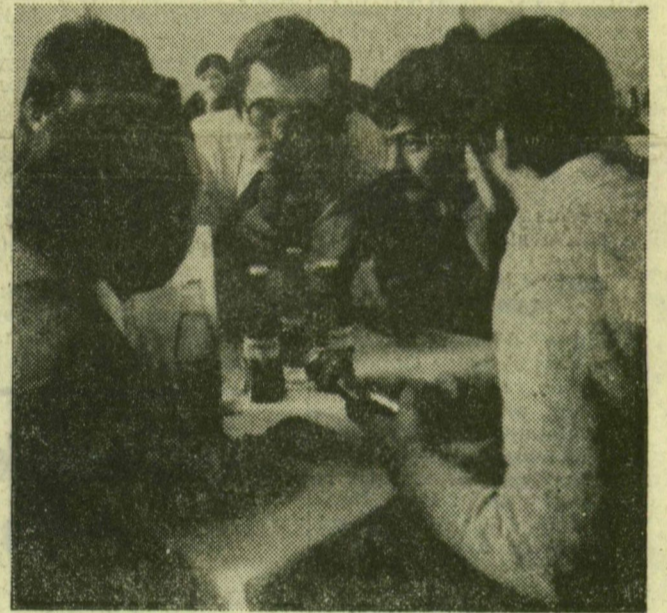
Munkában a győztes csapat

Huszonegy csapat 120 versenyzője mérte össze erejét a Köszöntünk VIT! Köszöntünk Havanna! vetélkedő városi döntőjében vasárnap a Tiszai szálló nagytermében. A tizenkét városi selejtezőn induló 118 csapat legfelkészültebb együtteseivel jutottak a városi döntőbe, ahol az egész napos verseny során számot adtak történelmi, társadalmi, politikai és kulturális felkészültségükről. A délelőtti írásbeli feladatok után tíz csapat versengett az első helyért, a győztes csapat részt vehet az országos területi selejtezőn.