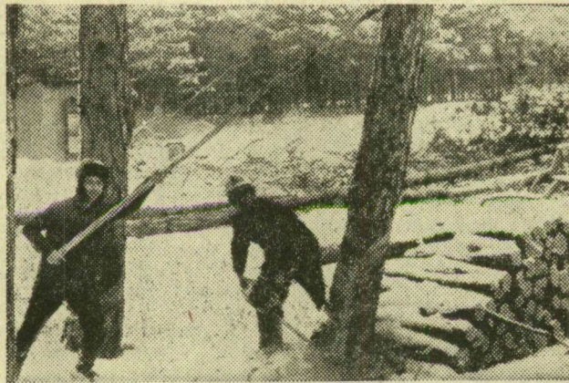
A fadöntés most is kéttemberek munka: egyik a fűrészgéppel vág, a másik arra vigyáz, hogy a fa oda dőljön, ahová kell.

A favágás igazi időszaka változatlanul a tél. A képhez hozzágondoljuk a havat, a munkához a hideget, a hideghez pedig azt a meleget, amit éppen a fa ad majd, ha tüzet teszik. Aki a mai favágók munkáját ismeri, odagondolja még a gépeket, de elveszi képzületben a tűz melegét. hiszen egyre kevesebben jütkenek fával. A ruzsai erdőben praktikus áépek segítik a téli favágók munkáját.