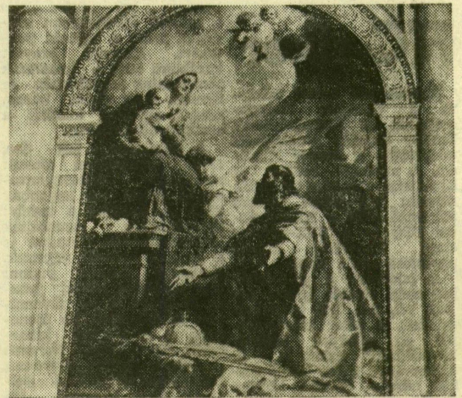
A budapesti Bazilikában látható Benczúr Gyula festménye: „A szent korona felajánlása”

lása a kor legjobb színvonalát mutatja, az alapra karcolt rajzok igazi művész kezére vallanak. Az alsó aroncs felső részére oromdíszeket forrasztottak.