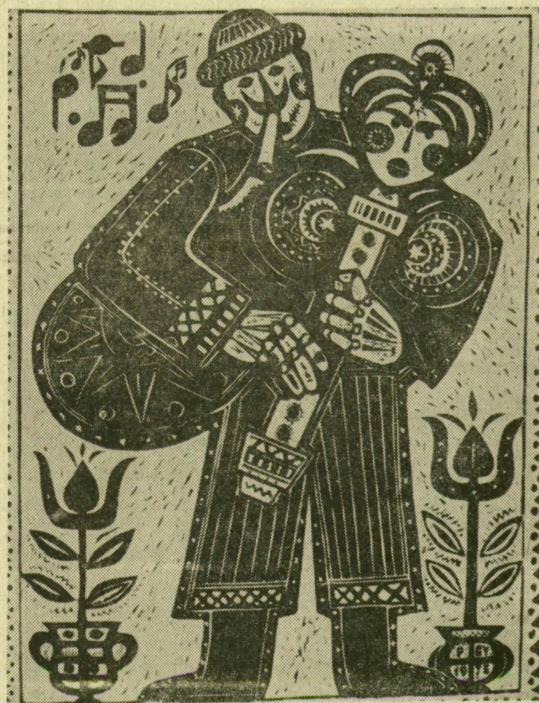
PAPP GYÖRGY BÖRDUDÁS