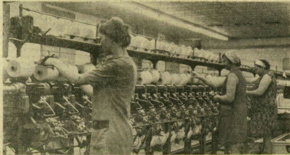
A Szegedi Textilművek Törekvő szocialista brigádjának tagjai a láncszélgépek mellett

Az idei munkaverseny legjelentősebb vállalásait mindenütt november 7. előtt teljesítették a dolgozók. A verseny azonban tovább tart, a termelőmunka sikeréhez az év hátralevő néhány hetében is szükséges a dolgozó közösségek igyekezete. A Szegedi Textilművek fonodájában a „B” műszak ért el legjobb termelékenységet a verseny november 7-ig tartott szakaszában. A szövődében elsősorban a kelmék minőségé alapján rangsorolták a műszakokat. Kimagasló eredményt ért el a „C” műszak közössége: szöveteiknek csaknem 98 és fél százaléka első osztályú volt. A Törekvő szocialista brigád tagjai üzeni rekordot értek el 99,4 százalékos első osztályú részarányal. A fonodában a Zrínyi Ilona és a Komócsin Zoltán brigádok végeztek a legjobb minőségű munkát, az előkészítő üzemből a Törekvő, Dorozsmán pedig a Rakéta brigád dolgozott legjobban. A láncszélgépek Törekvő brigád tagjai munkájának értékét növeli, hogy átlagos tel-