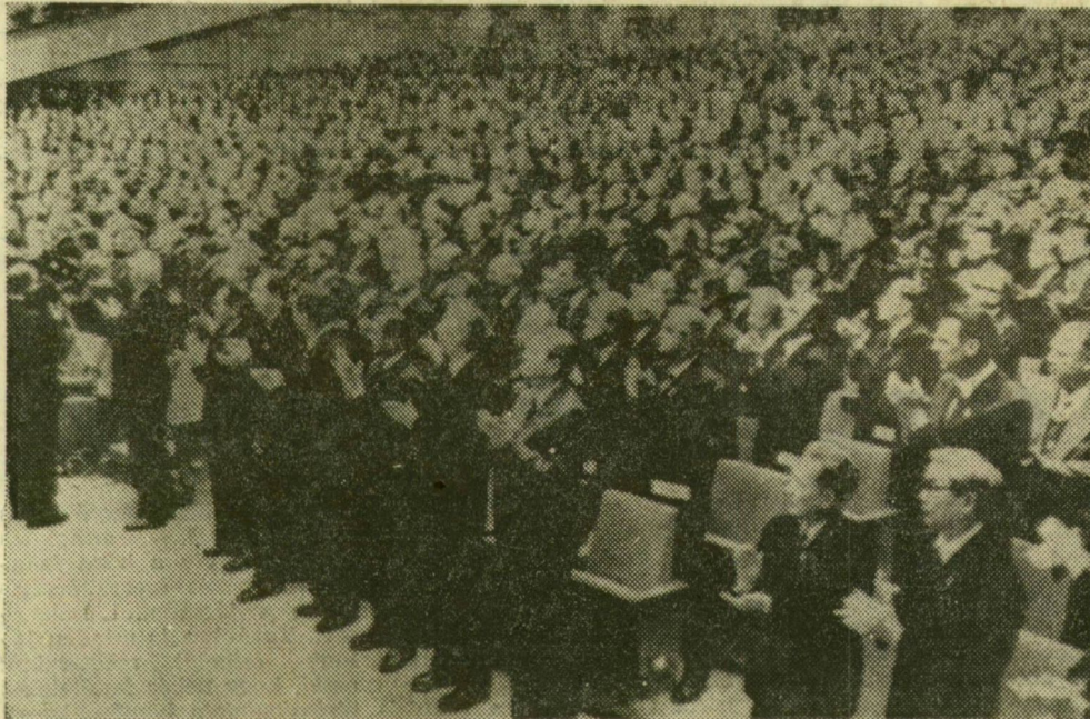
A moszkvai ünnepi ülészak tegnapi napjának egyik záróeseménye; a résztvevők tapssal köszöntik a felhívások elfogadását

Felhívás a világ és a Szovjetunió népeihez