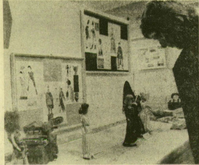
Részlet a kiállításról