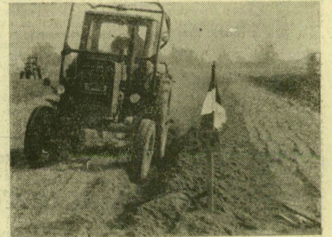
Versenypályán a traktorosok

Harmincnyolc MTZ-50-es traktor állt indulásra készen, katonás rendben, mellettük pedig izgatottan topogtak a fiatal traktorosok tegnap, szombaton reggel a balástyai határban, a helyi Alkotmány Termelőszövetkezet tarlóján. Lovázi József, a szegedi járási KISZ-bizottság titkárának megnyitóját követően a rajtszámokat és megkezdődött az idei ifjúsági szántóverseny.