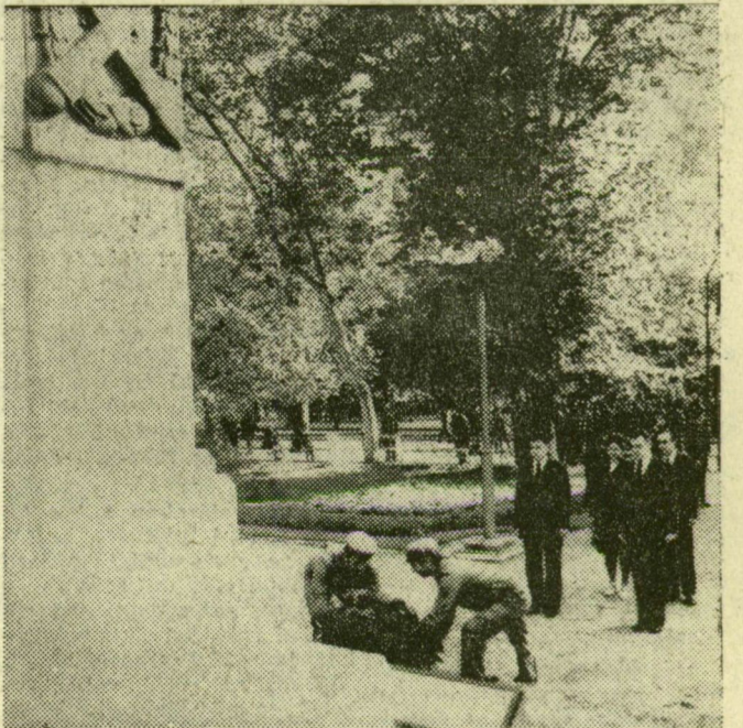
Koszorúzási ünnepség a Széchenyi téri szovjet hősi emlékműnél