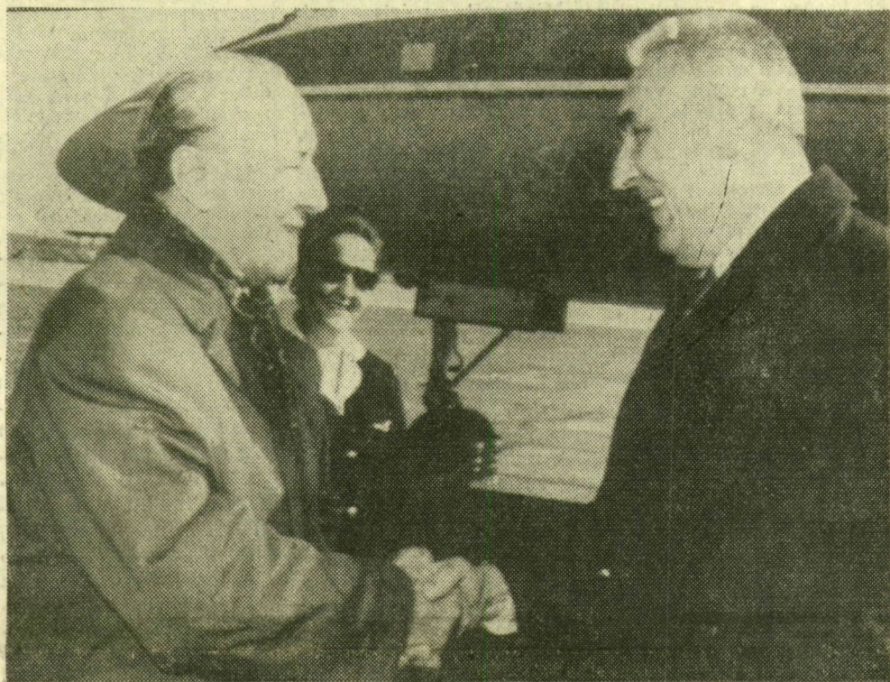
A repülőtéren: Kádár János fogadta Edward Giereket, a LEMP KB első titkárát