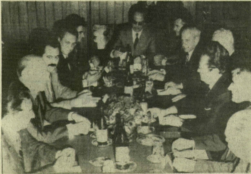
A tárgyalásztalnál: balról az MSZMP, jobbról a JKSZ küldöttsége

Az Eszék közelében levő tikvesi vadaskastélyban pénteken délelőtt megkezdődtek Kádár Jánosnak, az MSZMP KB első titkárának és Joszip Broz Titónak, a Jugoszláv Szocialista Szövetségi Köztársaság és a JKSZ elnökének tárgyalásai.