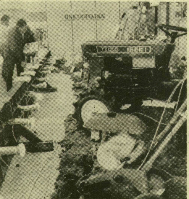
Jövőre hazánkban is kapható az Iseki négykerék-meghajtású kistraktor

A Vegyiműveket Építő és Szerelő Vállalat háti és kézi permetezőgépeket, valamint porozókát mutat be, melyeket Magyarországon a tiszkecskei gyáregység készít. Az első műanyag tartályú permetezőgép 1967-ben készült el, az azóta eltelt tíz esztendő alatt a vállalat úgy fejlesztette tovább ezeket, hogy jobban kihasználják a műanyagok előnyeit. Emellett üzembiztosabbá tették, valamint tetszetősebb és kisebb súlyú típusokat terveztek. A vállalat jelenleg négy permetezőgépet gyárt, ezek a D-2-M, a Vermorel, a Permike és Lepke. Gondoltak a lakásokban levő szobanövények védelmére is, ezért gyártják a félkilós Minipe kispermetezőt. A VEGYÉP-SZER gyártmányait a kereskedelmi vállalatoknál, mint az AGROKER, Hermes, a pécsi Titán és a győri Ferrorvill lehet megvásárolni. A por alakú növényvédő szerek kijuttatására szolgál az Orkán-típus.