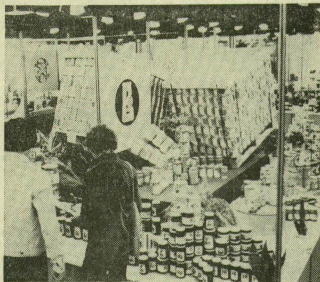
Gazdag választék jellemzi a konzervipari tröszt kiállítását

Vasárnap, az őszi BNV második napján borús, esőre hajló időben összesen mintegy 100 ezren látogatták meg a vásárvárost, így péntek óta már több mint 210