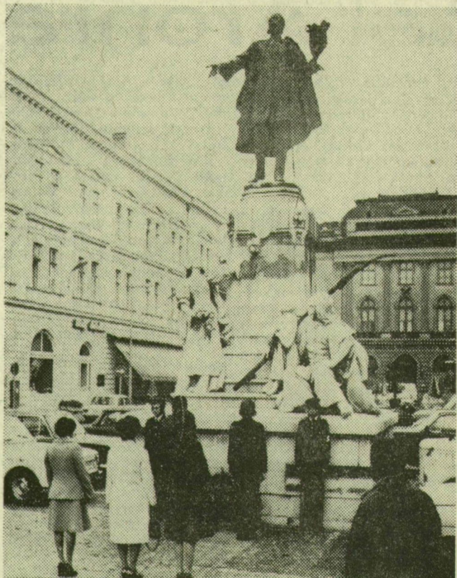
Koszorúzás a Klauzál téri Kossuth-szobornál

Százhetvenöt évvel ezelőtt — 1802. szeptember 19-én — született Kossuth Lajos. Az évforduló alkalmából hétfőn Budapesten koszorúzási ünnepséggel emlékeztek történelmünk nagy alakjára: előbb a róla elnevezett téren, az Országháznál álló szobrát, majd a Mező Imre úti temetőben levő Kossuth-mauzóleumot koszorúzták meg.