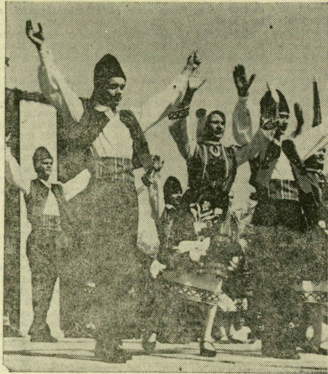
Az ÉDOSZ táncára