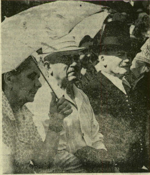
A résztvevők egy csoportja