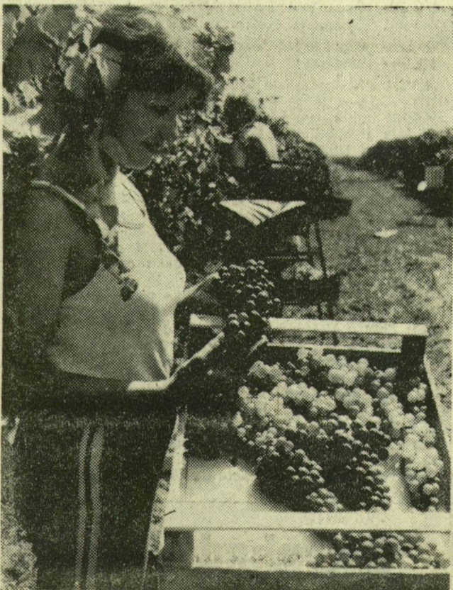
A szép fűrtöket ládába sorolva értékesíti az állami gazdaság

Elindultak a Szovjetunióba az első almásvagonok is. A Derekegyházi Állami Gazdaság és a szentesi Felszabadulás Termelőszövetkezet kezdte meg a téli alma szedését. Az őszibarackexportunk sem állt le, a csongrádi Vörös Csillag Tsz és a Derekegyhá-