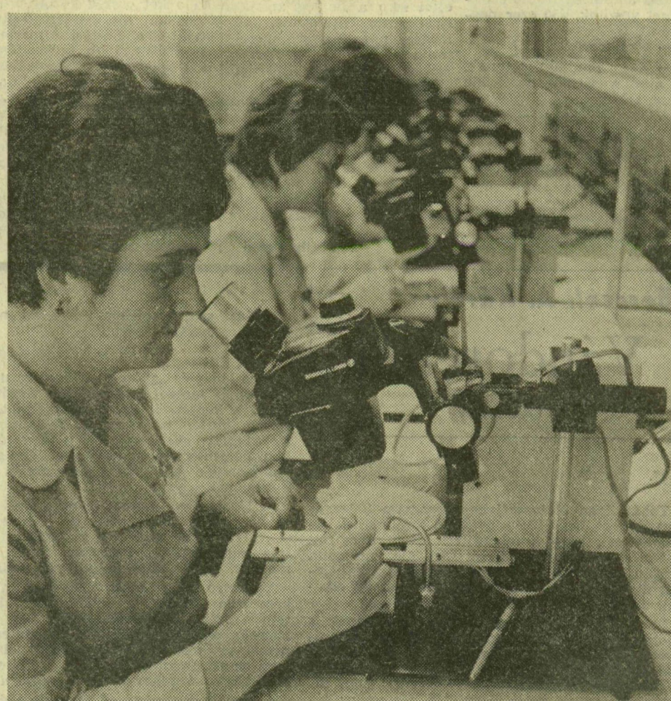
Forrasztás, mikroszkóp alatt

Az Egyesült Izzólámpa RT Gyöngyösi Félvezető- és Gépgyárában új, korszerű, integrált áramkört gyártó üzem kezdte meg működését. A 620 millió forintos költséggel létesült gyárüzem az amerikai FAIRCHILD cég szállította a gyártóberendezések többségét, adta a technológiát, a szakemberek egy részét is az Egyesült Államokban képezték ki. A tervek szerint 1978-ban 12 millió integrált áramkört készítenek majd az új üzemben a hazai és a tőkés piacra. Képünkön: Mikroszkóp alatt forrasztják össze az integrált áramkörök elemeit.