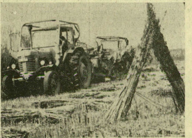
Munkában a kenderkombájnok

A Kenderfonó és Szövőipari Vállalat telepeire már egymást után érkeznek az idei kőróval megrakott járművek. A vállalat szakembereinek megítélése szerint megtermelt a kenderipar nyersanyaga, mégpedig jó minőségben. Egyenletes, finom rostú a kőró, olyan, amelyet várnak és a legszebben fogadnak a feldolgozó üzemek. A kedvező ütemű betakarítás, a nyersanyag megfelelő minősége egyben a Szegedi Kendertermelési Rendszer technológiájának sikerét is jelenti. A képeken: a komplex betakarítás két legfontosabb munkafázisa látható, földművelés helyén határában, a mártélyi Fürst Sándor Tsz földjein.