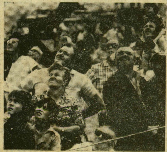
A repülők bemutatóját figyelik

A felhős égbolt, s főleg a mindinkább feltámadó, a magasban viharos erejű szél lehetetlenné tette a nap egyik fő eseményének lebonyolítását: nem mutathatták be tudásukat az ejtőernyősök. A jól rendezett szegedi honvédelmi nap azonban így is betöltötte szerepét, hű képet adott a bemutatókat végrehajtók tudásáról, s nagyban hozzájárult honvédelmi felkészültségünk megemeléséhez. S a fő cél éppen ez volt!