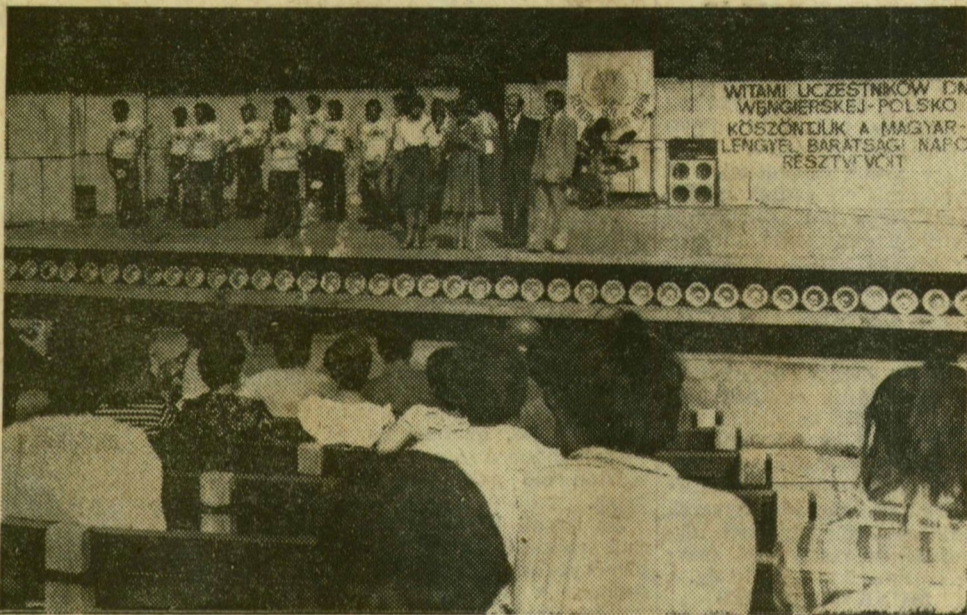
Az ifjúsági napok megnyitója

Városunkban folytatódik a magyar–lengyel barátsági napok programja