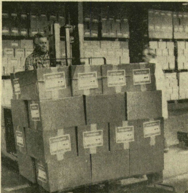
A Szegedi Konzervgyár dolgozója exportárut rak a nemrég elkészült iparvágányon álló vagonba

Húsz országba 10 ezer 259 tonna árut exportált idén az első felében a Szegedi Konzervgyár. Sok ez, vagy kevés? Az elmúlt évi kivitelhez képest kevés, az idei tervezett mennyiséghez hasonlítva sok. Ha pedig azzal a tömeggel vetjük össze, amelyet év végéig kell küldeni a külföldi megrendelőknek, azt mondhatjuk, hogy megfelelő a szállítások üteme. Igaz, az éves terv szerint 30 ezer tonna árut kell exportálni, vagyis az ilyen feladatok csaknem kétharmad részét ezután kell megoldani, aggodalomra nincs ok, mert a munka java mindig a második felévre marad. Babból, hámozatlan paradicsomból, lecsóból és más árukból tekintélyes mennyiség hagyja el a konzervgyárat a közeli hónapokban.