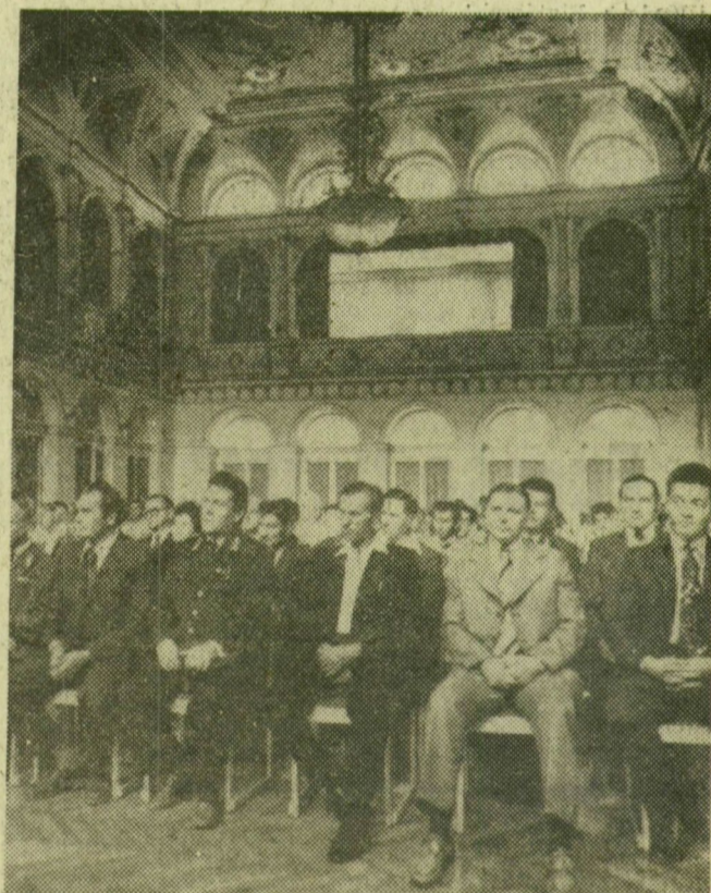
Kitüntetett vasutasok egy csoportja az ünnepségen