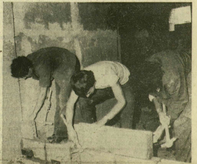
Az építőipari szakközépiskola fiataljai közül néhányan fürdőszobafalat építenek a Neme-takács utcai OTP-társasházban

A tanításnak vége, de a pi-gasépítési munkákat, többen üzemi gyakorlaton kell részt venniük a szakközépiskoláknak, hogy időben tapasztalatokat szerezzenek a termelőmunkáról. Két vállalat-hoz látogattunk el, hogy a fiatalok munkájáról érdeklődjünk. A Dél-magyarországi Magas- és Mélyépítő Vállalat a Vedres István Építőipari Szakközépiskola 62 fiatalját fogadta. A tanulók közül legtöbben a magasépítőknél dolgoznak, mások a KISZ-táborban végeznek ma-gasépítési munkákat, többen az Északi városrészen pá-nelházakat alapoznak. A Kenderfonó és Szövőipari Vállalat szegedi kenderfonó-gyárába a Textilipari Szakközépiskola 35 főnő tagozatos tanulója látogatott, s minden héten más munkaterületen próbál helytállni. A volt el-ső és másodévesek fizikai munkát végeznek, a harmadikosok művezetők mellett ismerkednek a termelőmunkáknál dolgoznak, mások a ka közvetlen irányításával.