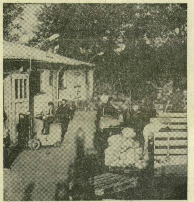
Hajnali fél 5-kor már „felt ház” van a központi telepen